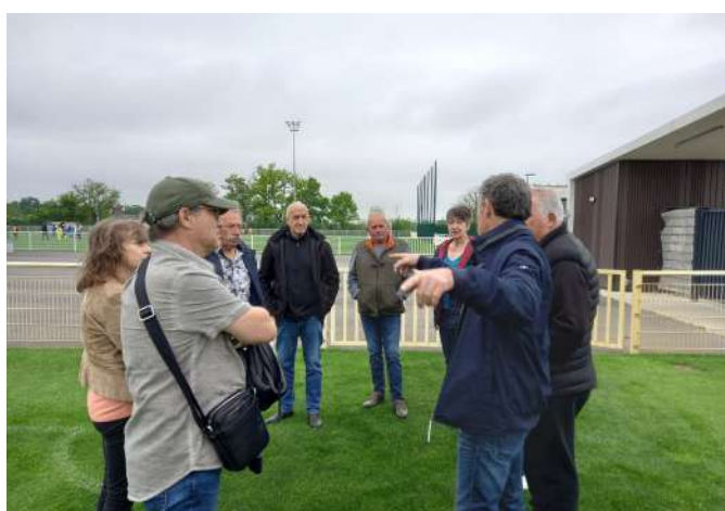
Sportivement Le club de football